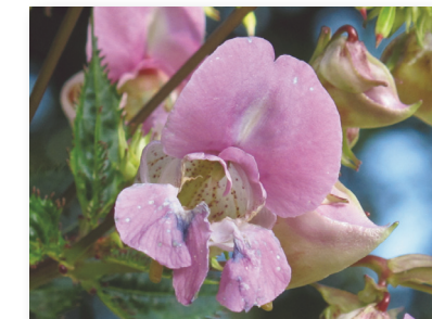
Balsamine de l'Himalaya

(définition de l'union internationale pour la conservation de la nature UICN)